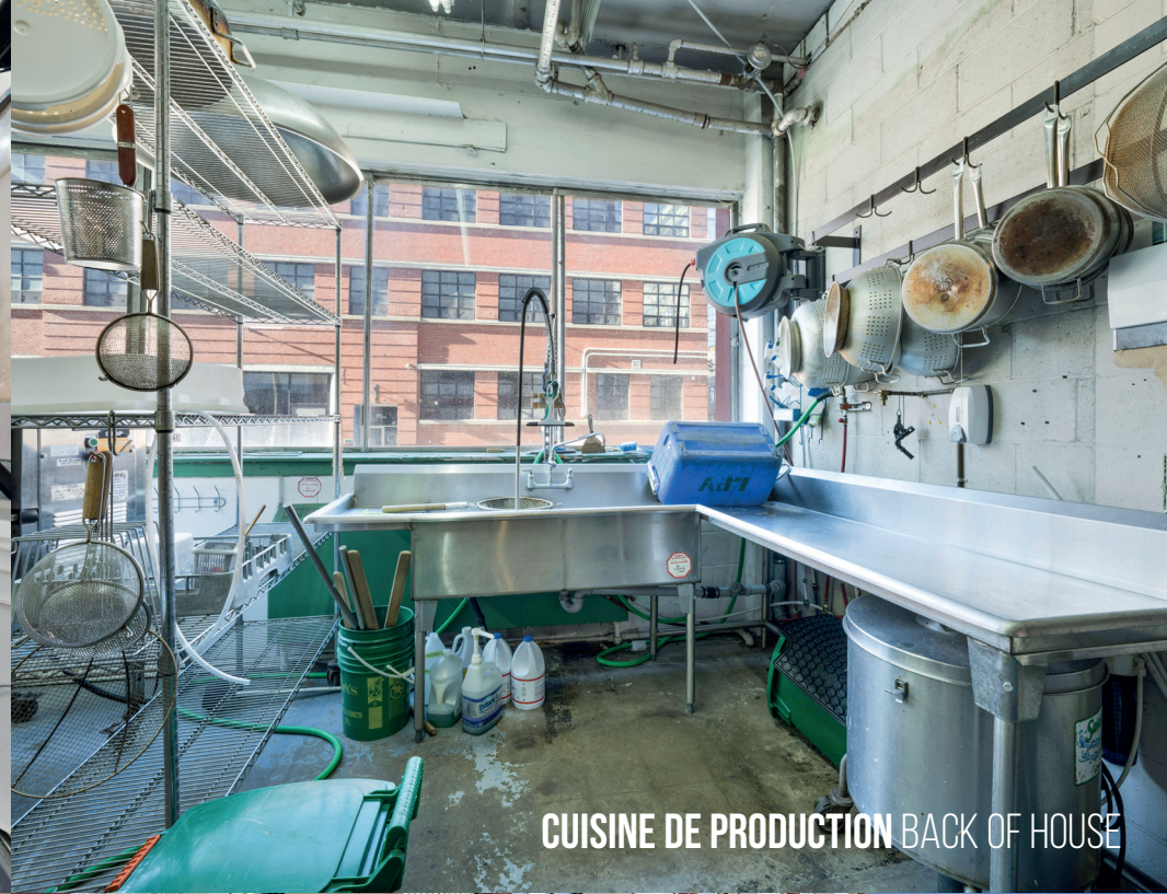
CUISINE DE PRODUCTION BACK OF HOUSE