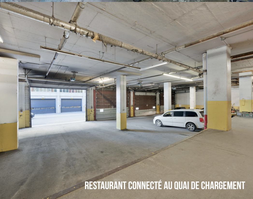
RESTAURANT CONNECTÉ AU QUAI DE CHARGEMENT