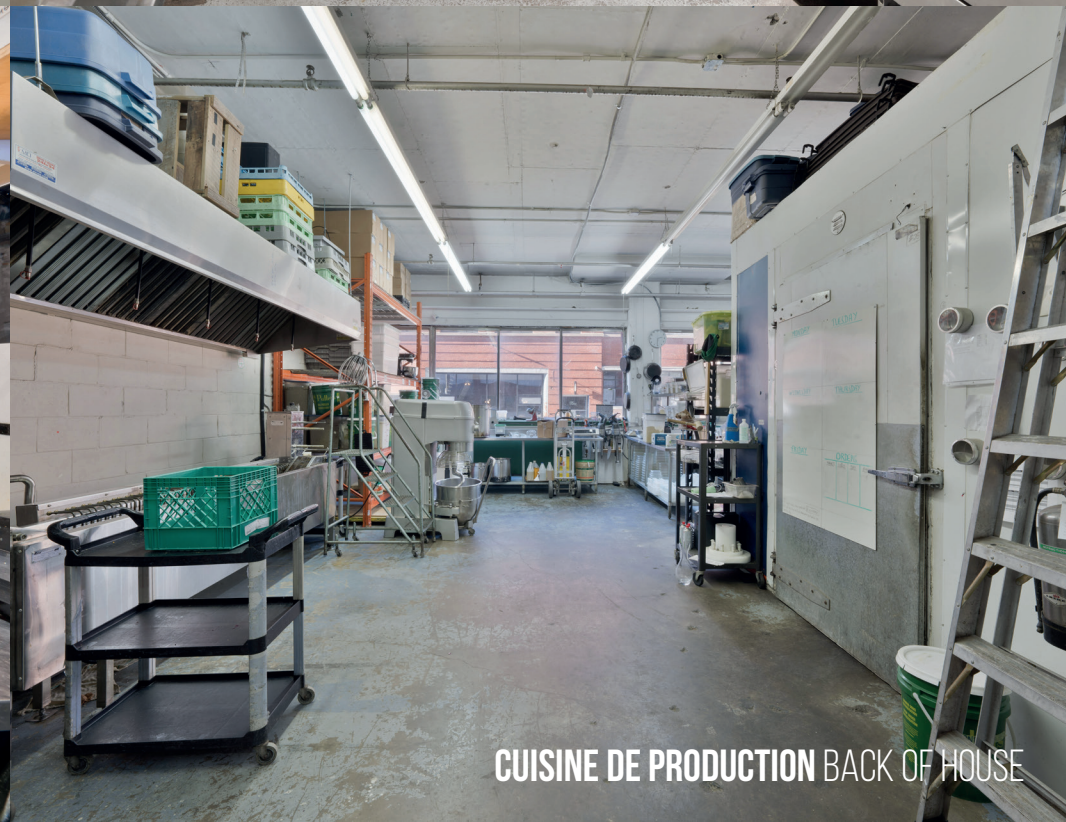
CUISINE DE PRODUCTION BACK OF HOUSE