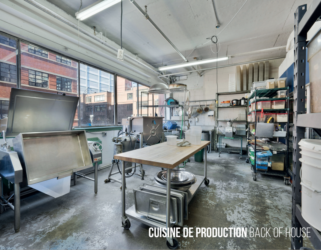
CUISINE DE PRODUCTION BACK OF HOUSE