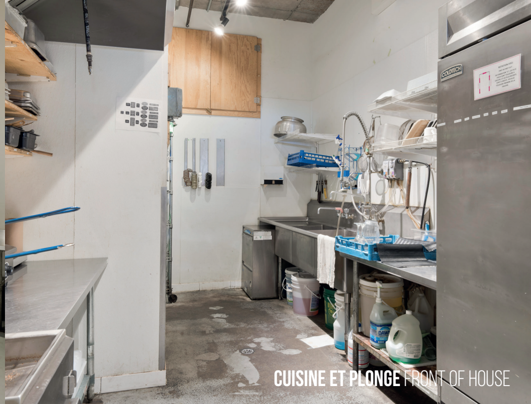
CUISINE ET PLONGE FRONT OF HOUSE