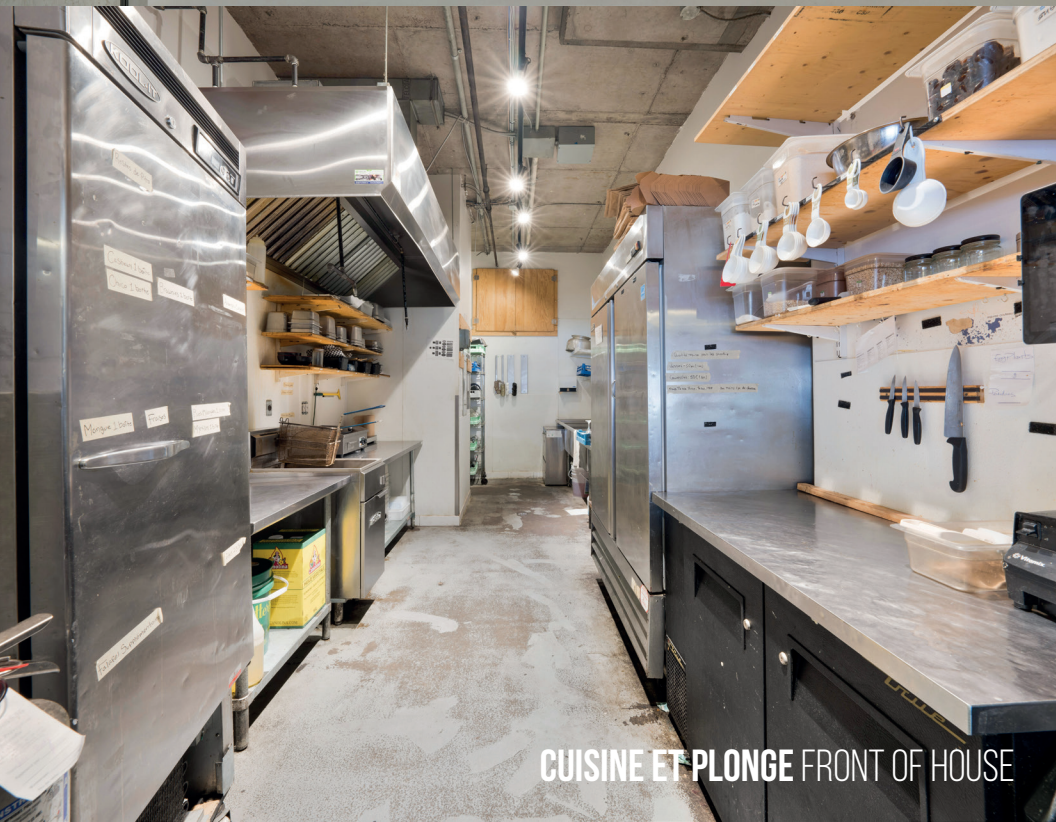
CUISINE ET PLONGE FRONT OF HOUSE