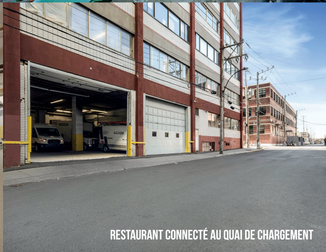
RESTAURANT CONNECTÉ AU QUAI DE CHARGEMENT