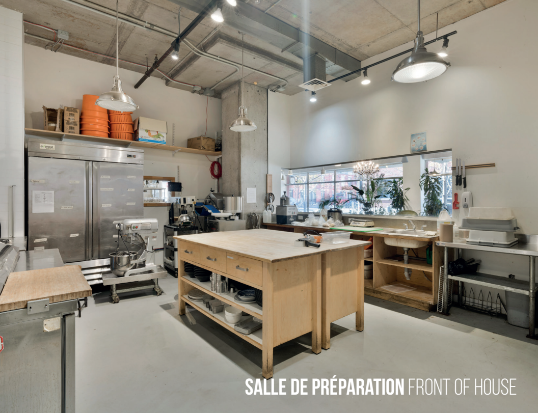
SALLE DE PRÉPARATION FRONT OF HOUSE