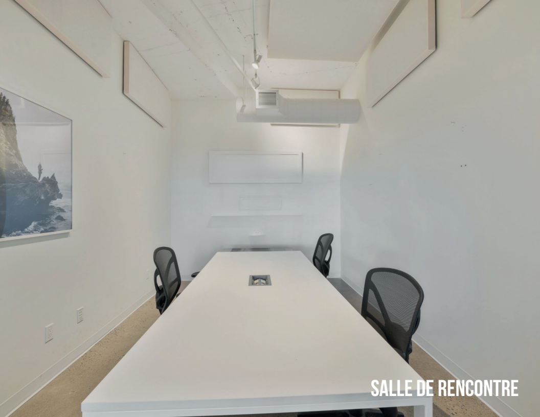
SALLE DE RENCONTRE