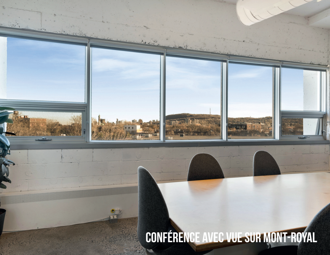
CONFÉRENCE AVEC VUE SUR MONT-ROYAL