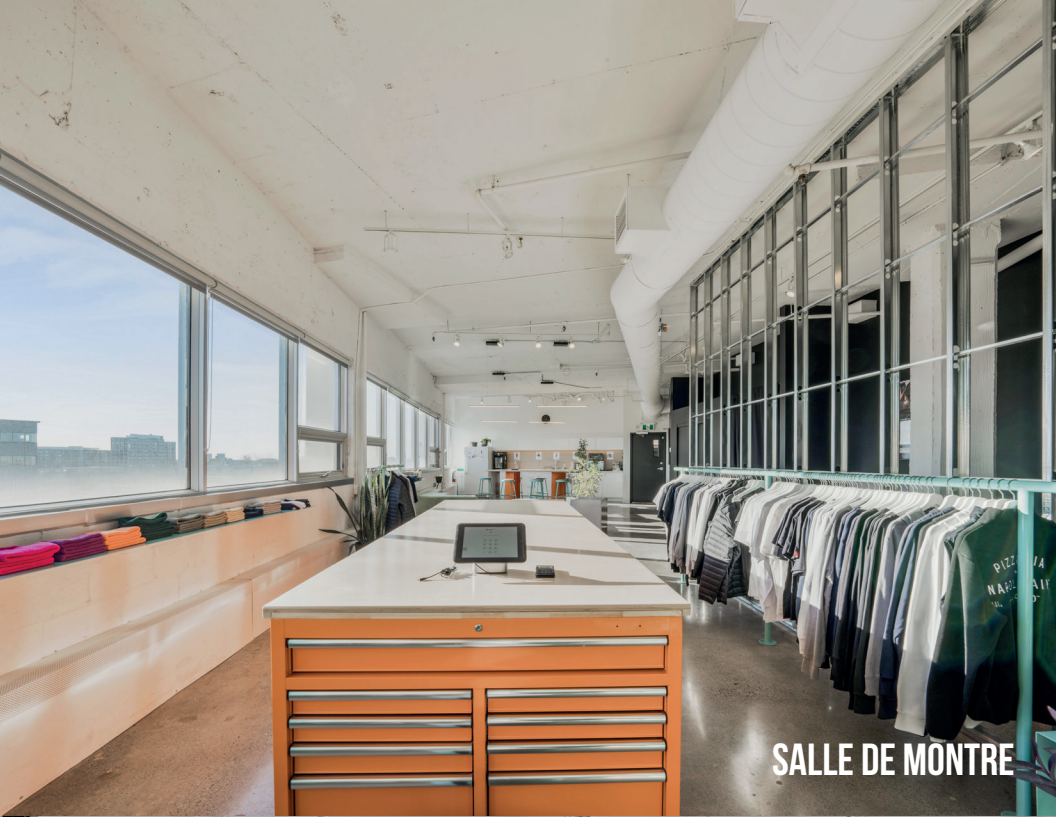
SALLE DE MONTRE