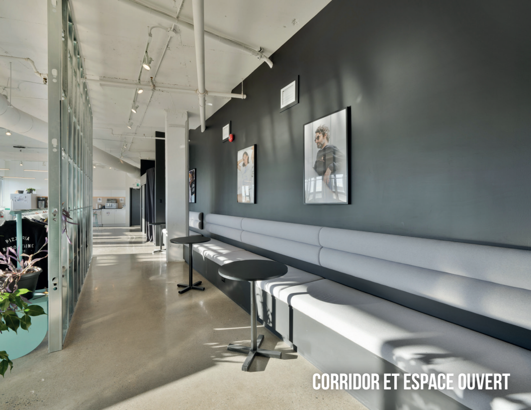
CORRIDOR ET ESPACE OUVERT