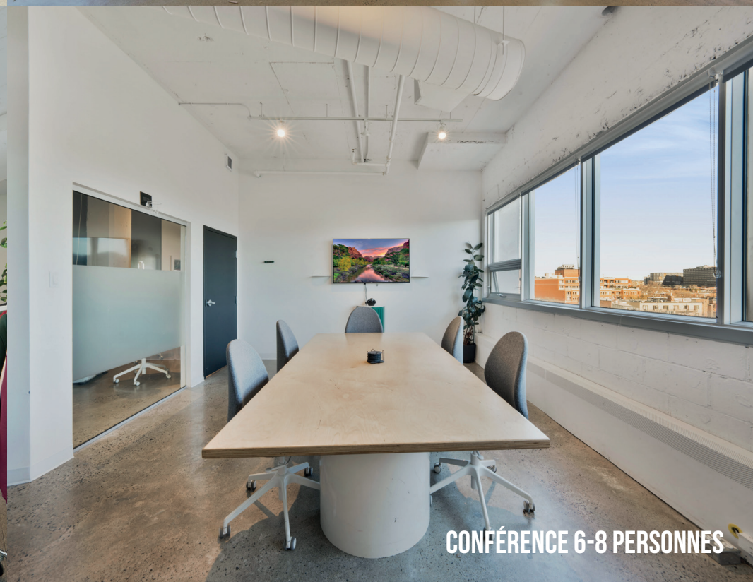
CONFÉRENCE 6-8 PERSONNES